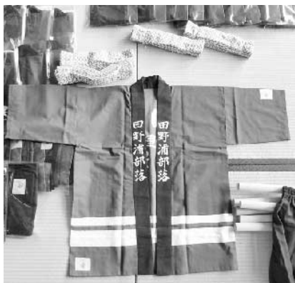
【田野浦地区】法被や着物、天狗衣装などを購入。