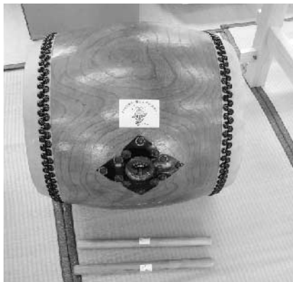
【入野本村地区】法被や太鼓、提灯、紅白幕などを購入。