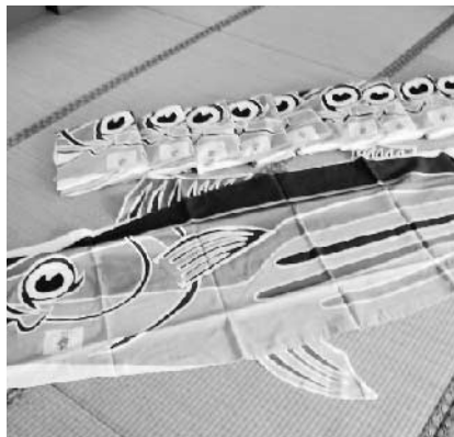
【坂折地区】法被やカツオのぼりなどを購入。