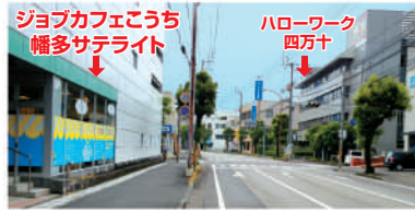
黄色と水色のデザインが目印です。

支援メニューはすべて無料でご利用できます。4月にアピアさつき内で移転しました。どうぞお気軽にお越しください。