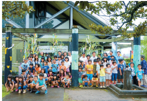
七夕の飾り付けが終わって集合写真を撮りました。(土佐入野駅前にて)

土佐くろしお鉄道を盛り上げるため、7月4日、土佐入野駅と土佐賀駅にて大方ライオンズクラブ主催の「七夕飾りでおもてなし」というイベントが行われました。