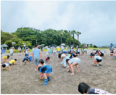
宝探し・宝うばいの際には雨もあがり大いに盛り上がりました。