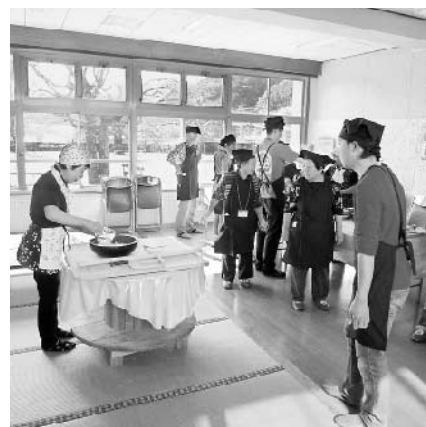
先生のそばの打ち方を真剣に見る参加者。