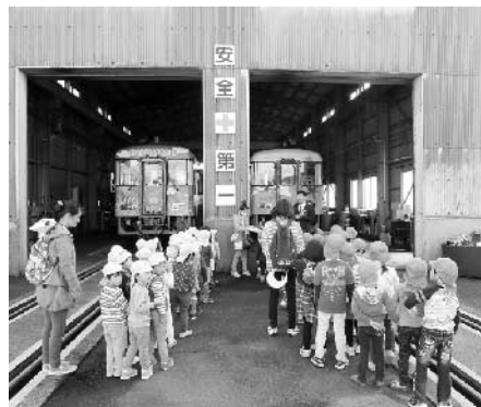
列車の格納庫前で職員の方が園児に車内でのマナーや安全確認などの話しをしました。

12月11日、土佐入野駅で大方中央保育所の園児によるクリスマスツリーの飾り付けが行われました。園児たちは事前に保育所で作ってきた飾り付けをツリーに飾ったり、サンタクロースも駆けつけてくれ、クリスマスの雰囲気を楽しみました。 飾り付けをした後は、列車に乗り中村駅に行き、列車格納庫の中を見学。間近に見る列車に園児たちは興味津々の様子でした。