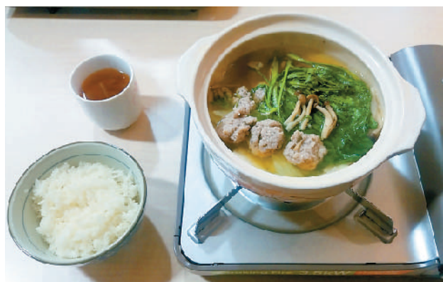
新メニューとして登場した「エソのつみれ鍋」。写真に漬物がつきます。つみれは野菜の下にも、隠れています。