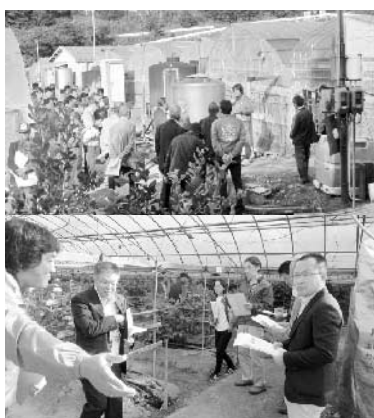
花卉団地で研修する参加者

県外から本町への現地研修会参加者34人は、花卉団地・黒潮町農業公社・道の駅ビオス大方・JA佐賀支所が行う事業を視察し、新規就農者育成ならびに庭先集荷による高齢者の見守りなど本町の活動に対して活発な意見を交わしました。今後も県内外の地域交流を深めることで、地域農業の発展につなげていきます。