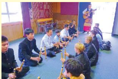
マオリ文化の体験