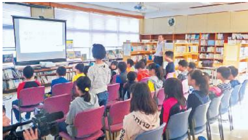
学習会に参加する児童ら

佐賀漁港の建設の経緯や漁港の役割、建設にかかった費用など、漁港について学習を深め、また地震についても同様に学びました。