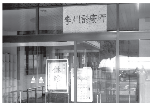
常勤医師の待たれる拳ノ川診療所