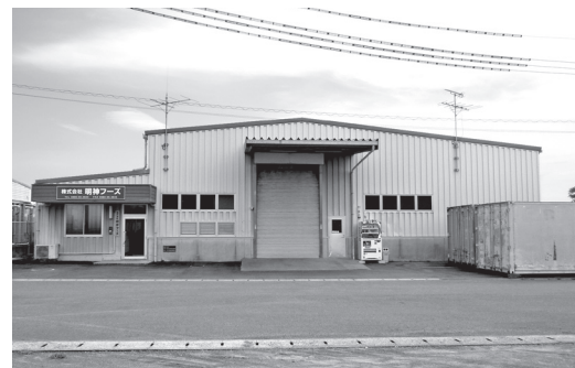
明神フーズ（佐賀港北側）