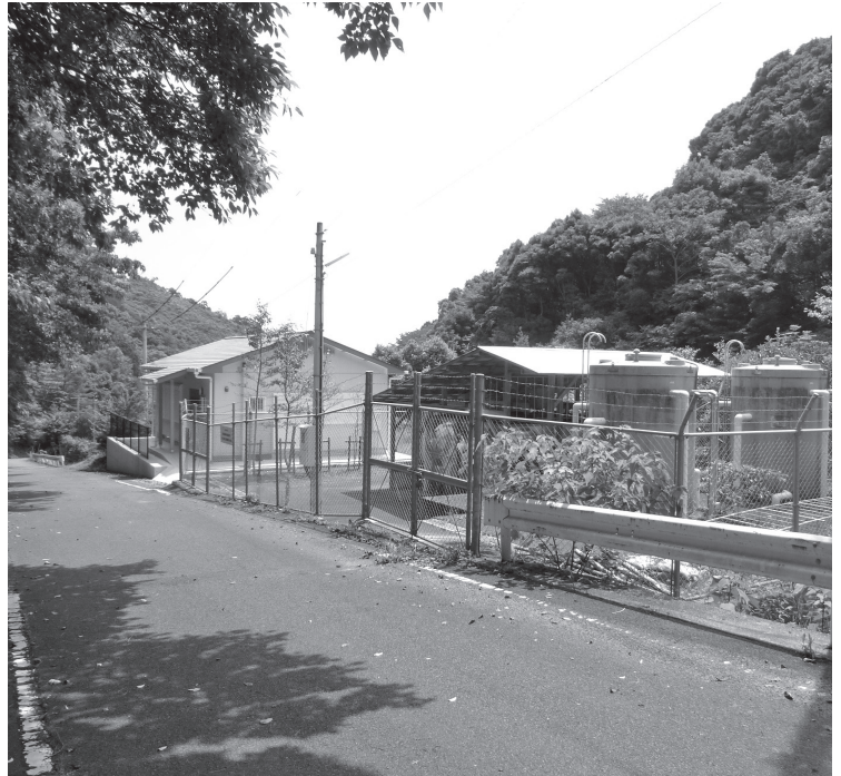
津波浸水区域外（貯水池側）に新設された熊野浦集会所 （写真奥側が海側）

出資額の25・1%1278万円を出資し、今年度新会社を設立した。これを受け、地方自治法の規定により、条例制定を行うもの。 可決（全員）