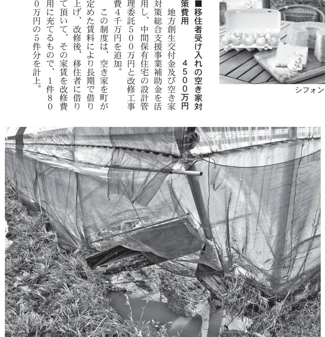
台風 16 号により被災したビニールハウス