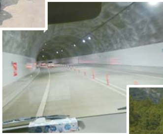
◀金上野トンネル(1916m)内部。きれいに舗装されて、消火栓等の内装工事が行われていました。

3月15日、総務教育常任委員会と産業建設厚生常任委員会で平成30年度の早い時期に開通を目指している高規格道(四万十町金上野～拳ノ川)と、本年4月に開所する新佐賀保育所(伊与喜)を視察しました。