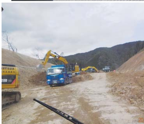
◀ユンボにより法面掘削もドローンで撮影した画像を元にデータ化した法面の傾斜角の入力で、熟練作業員でなくても削れるとのこと