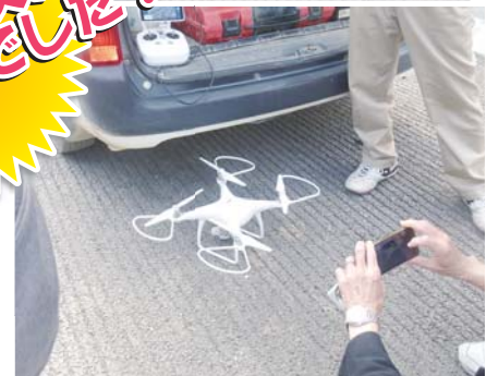
▲工事の設計・測量から検査まで大活躍のドローン