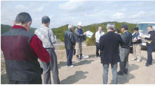
▲国交省の担当者から概要説明を受け、視察開始です